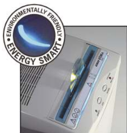
ENERGY SMART Risparmio di energia in stand-by