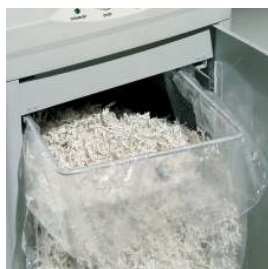
Facilità di svuotamento del sacco raccogli-sfridi