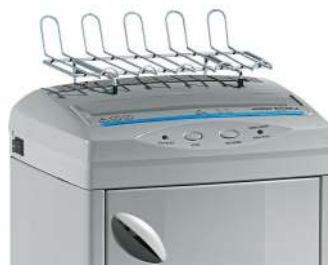
Ripiano portatabulati e portadocumenti